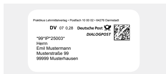
Muster für DV-Freimachung mit Datamatrixcode im Fenster

Weitere Einzelheiten zur Frankierung über DV-Freimachung finden Sie hier: deutschepost.de/dv-freimachung