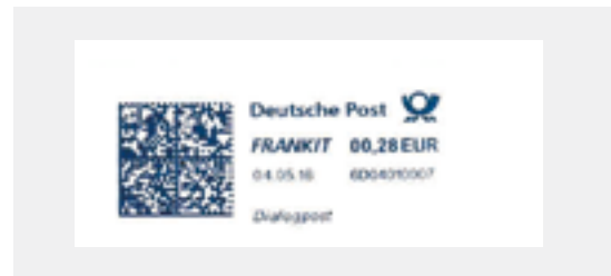
Muster für FRANKIT Frankiervermerk

Die Frankierung von DIALOGPOST ist auch über Frankiermaschinen – sowohl über die bisherigen, klassischen Frankiermaschinen als auch FRANKIT Maschinen – möglich. Die Frankierung erfolgt hierbei nur über den jeweiligen Basispreis. Zuschläge und weitere Services der DIALOGPOST sind über die zu erstellende Einlieferungsliste gesondert abzurechnen. Bei FRANKIT Maschinen wird im Frankiervermerk der Hinweis „DIALOGPOST“ angedruckt. Der bei klassischen Frankiermaschinen erstellte Hinweis „Entgelt bezahlt“ wird bei der Einlieferung vorerst weiterhin toleriert.