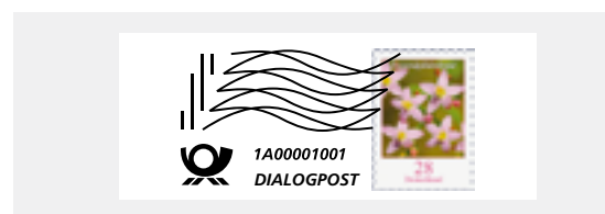
Muster bei Verwendung digitaler Drucksysteme (In Schwarz, ohne Datum, mit individueller Seriennummer)

Keine passenden Postwertzeichen? Die Differenzbeträge bis zum nächsthöheren Postwertzeichen ersetzen wir Ihnen.