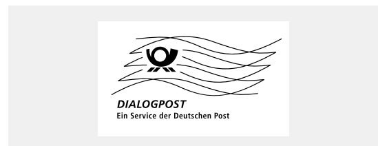
Muster für Frankierwelle DIALOGPOST