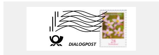
Muster für PLUSBRIEF

Mehr Infos erhalten Sie in der Broschüre „Das Plus für Ihr Geschäft: Umschlag plus Marke in einem“ oder im Internet unter plusbrief.de