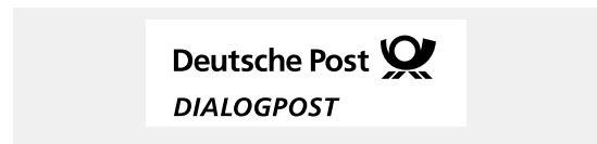
Muster für verkürzten Frankiervermerk

Der verkürzte Frankiervermerk wird innerhalb der Aufschrift angebracht. Der Vermerk ist gut sichtbar/lesbar rechts oberhalb der Anschrift zu platzieren (Muster unter deutschepost.de/frankiervermerk ). Die Frankierzone ist in diesem Fall von alphanumerischen Angaben in Klarschrift und Codes jeglicher Art frei zu halten, darf jedoch farbig bedruckt werden. Für die Frankierung von DIALOGPOST ohne Umhüllung ist der verkürzte Frankiervermerk daher besonders geeignet.